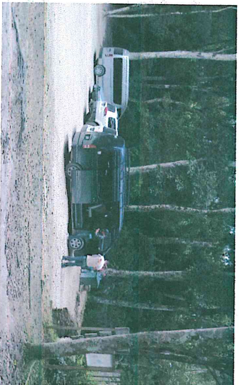
Fig. 4: Atención y registro de visitantes en el área de parque.

Se supervisan las actividades de visita y de otros fines en la zona de uso público con el fin de prevenir e identificar posibles inconvenientes que afecten a los elementos de conservación o la seguridad de los visitantes. Durante enero y febrero, la atención de los visitantes es realizada por los tres grupos, vigilancia, mantenimiento y conservación, debido al periodo vacacional del segundo grupo de trabajo.