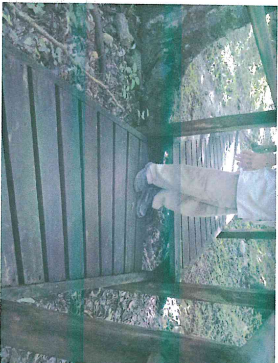
Fig.3: Revisión del estado de la infraestructura, descanso de escalinata en mal estado.